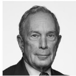
MICHAEL R. BLOOMBERG